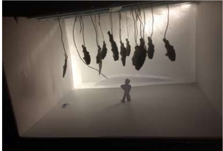
projet de scénographie

À l'avant-plan, un espace vide où sont pendus d'innombrables poissons, de toutes tailles, et d'où suinte lentement de l'eau – à la place des yeux, des haut-parleurs diffusent les voix off.