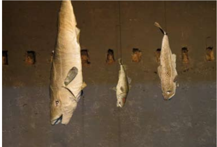
projet de scénographie

À l'avant-plan, un espace vide où sont pendus d'innombrables poissons, de toutes tailles, et d'où suinte lentement de l'eau – à la place des yeux, des haut-parleurs diffusent les voix off.