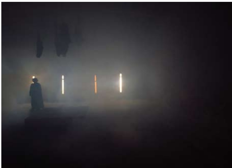
photo de répétitions

Par endroits dans cet espace, la comédienne peut venir se placer sous une myriade de sortes d'électrodes, dressées souplement autour de sa tête ; à l'extrémité de certaines d'entre elles sont fixés d'autres petits haut-parleurs, d'où sortent également les voix off.