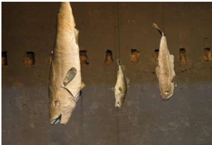
projet de scénographie

À l'avant-plan, un espace vide où sont pendus d'innombrables poissons, de toutes tailles, et d'où suinte lentement de l'eau – à la place des yeux, des haut-parleurs diffusent les voix off.