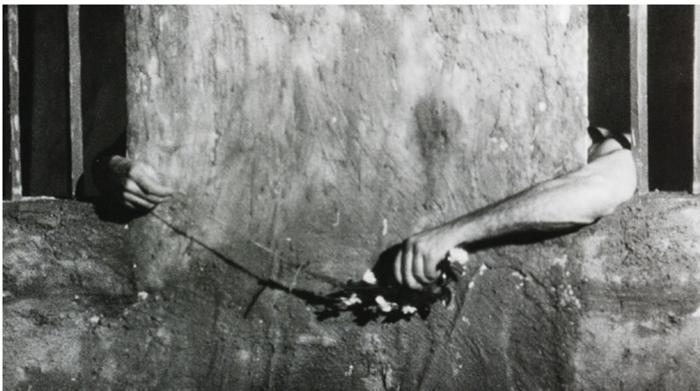
© Un chant d'amour, Jean Genet

« Un Chant d'Amour a su atteindre à la sensibilité vraie, à la violence contenue. Les affres, les désirs d'un prisonnier homosexuel, ses relations avec son geôlier y prennent figure humaine, atteignent à une poésie franche, sincère, dépourvue de toute obscénité. La vision du prisonnier qui se masturbe est plus déchirante dans son indicible cruauté que basement pornographique. Là où « Flaming Creatures » de Jack SMITH veut choquer, Un Chant d'Amour se contente d'émouvoir. » Jean Mitry, « Le Cinéma Expérimental », 1974